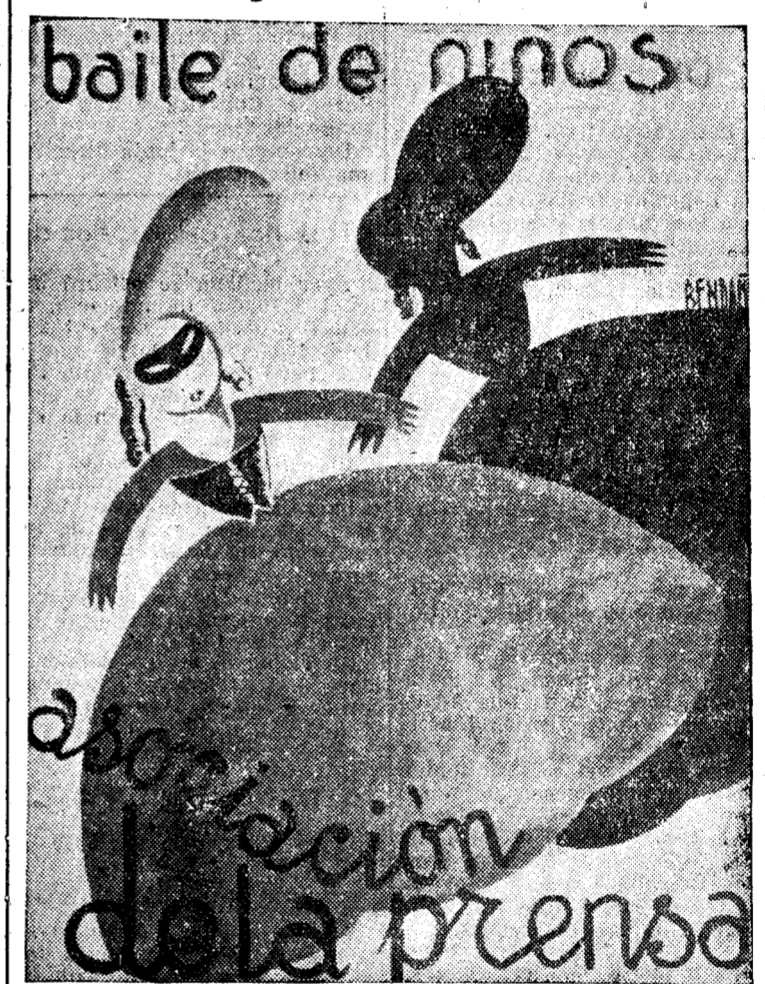
Notable cartel anunciador, obra del distinguido artista señor Bendaña

Hoy, el de niños y mocitos.—Mañana, asalto y baile de noche